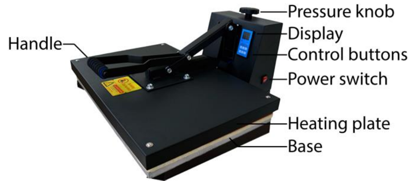
Figure 1. STM-46S Heat Press